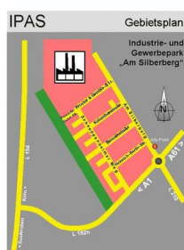
IPAS - Übersicht mit Straßennamen