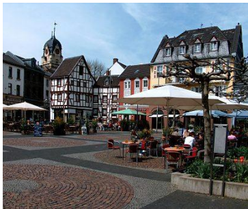
Alter Markt, Euskirchen

Die Kreisstadt Euskirchen liegt landschaftlich reizvoll im Städtedreieck Aachen (70 km) - Bonn (30 km) - Köln (40 km). Dies ist ein Grund, warum sich Euskirchen, mit über 58.000 Einwohnern, zu einem attraktiven und dynamischen Mittelzentrum mit oberzentralen Funktionen entwickelt hat. Garant für die positive Entwicklung sind leistungsstarke Handwerks-, Handels-, Gewerbe- und Industriebetriebe, die sich in Euskirchen als größter Stadt des gleichnamigen Kreises niedergelassen haben.