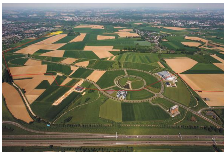
Grenzenlose Möglichkeiten auf AVANTIS!