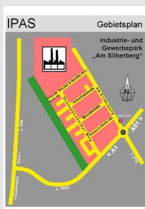
IPAS - Übersicht mit Straßennamen