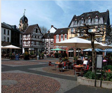
Alter Markt, Euskirchen

Die Kreisstadt Euskirchen liegt landschaftlich reizvoll im Städtedreieck Aachen (70 km) - Bonn (30 km) - Köln (40 km). Dies ist ein Grund, warum sich Euskirchen, mit über 58.000 Einwohnern, zu einem attraktiven und dynamischen Mittelzentrum mit oberzentralen Funktionen entwickelt hat. Garant für die positive Entwicklung sind leistungsstarke Handwerks-, Handels-, Gewerbe- und Industriebetriebe, die sich in Euskirchen als größter Stadt des gleichnamigen Kreises niedergelassen haben.