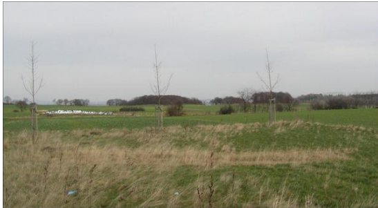
Geplantes Gewerbegebiet Gey