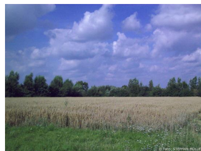
Grundstück neben GLS