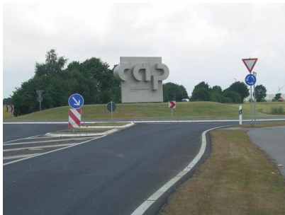
Eingangstor zum Carl-Alexander Park